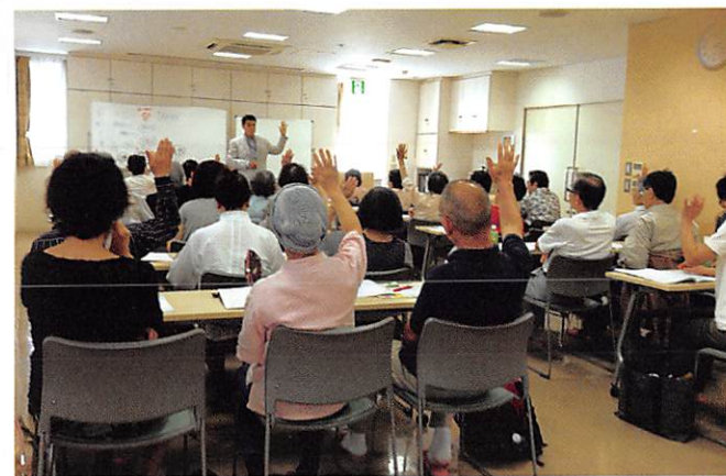
「終活セミナー」の様

『人生まるごと支援』相談員による『終活セミナー』開催中。 出張講座もお受けしています。